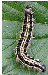
Der kleine Fuchs